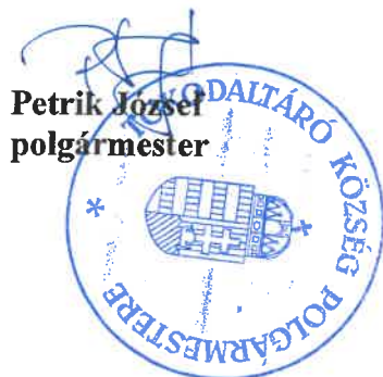
Petrik József polgármester

Határidő: a bérleti szerződés megkötésére a döntést követő 15 napon belül