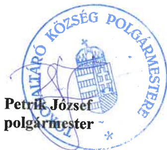
Petrik József polgármester

Határidő: a bérleti szerződés megkötésére a döntést követő 15 napon belül