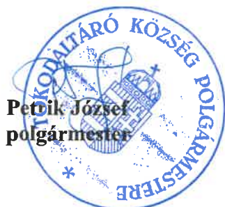
Petrik József polgármester

2. pont vonatkozásában: 2025. december 15.