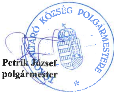
Petrik József polgármester

Határidő: a bérleti szerződés megkötésére a döntést követő 15 napon belül